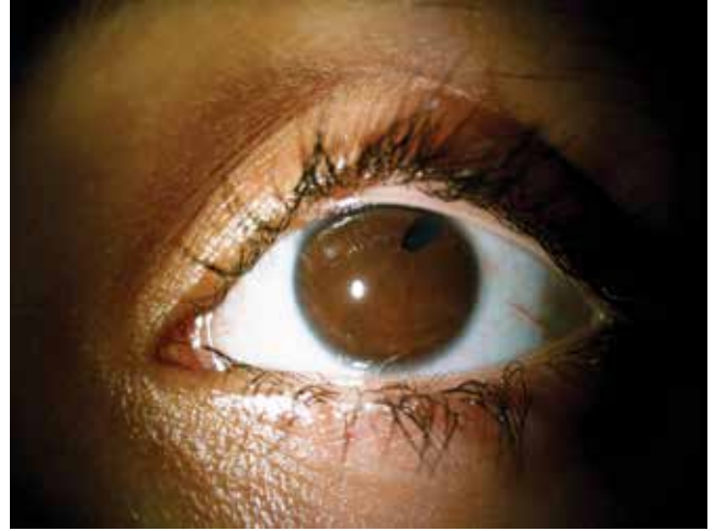
Resim 2. Sol gözde pupil ektopisi

Lens kolobomu gerçek bir kolobom değildir, lens ekvatorunun bölgesel gelişme eksikliği ve zonül yokluğu mevcuttur. Bu durum izole olabileceği gibi iris ve koroid kolobomları ile birlikte olabilir. 5 Literatürde lens kolobomu ile birlikte retina dekolmanı 6,7 , kar tanesi retinal dejenerasyon 8 , optik disk kolobomu 9 , optik sinir hipoplazisi ve orbital hemanjiyom 10