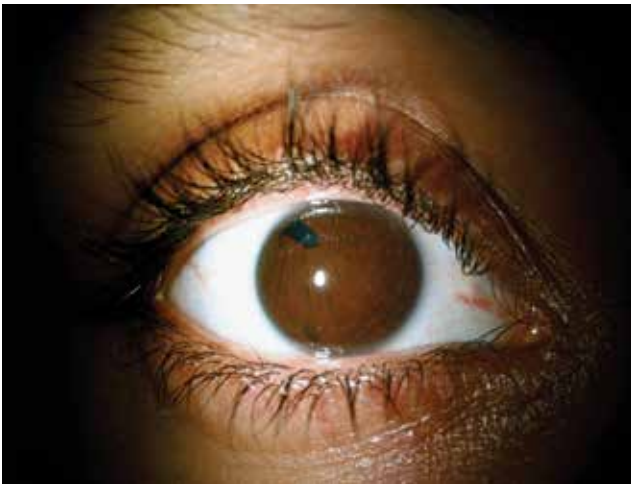
Resim 1. Sağ gözde pupil ektopisi