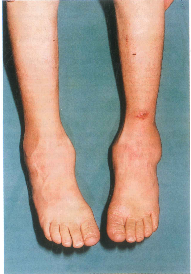
Resim 2. Z.B.'nin ayak bileklerinin görünümü

Tedavisinde sağ göze suni gözyaşı başlanan ve sola bandaj yumuşak kontakt lens ve antibiyotikli damla uy-