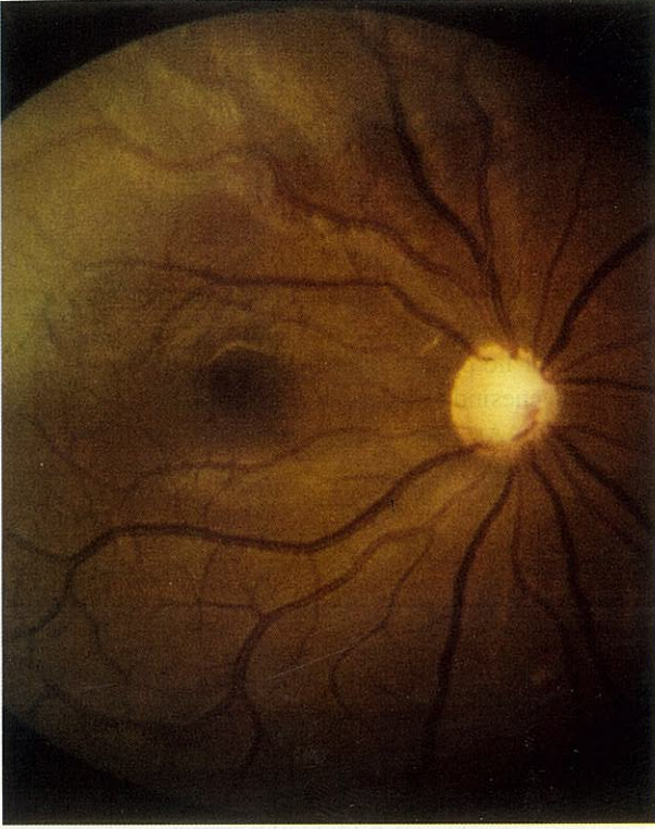
Şekil 1. (A) Sağ gözdeki muayenesinde totale yakın glokomatöz optik atrofi (B) Sol gözdeki muayenesinde hem arterlerde hem de venlerde aşırı dilatasyon ve kıvrım artışı, ve gözde dumanlı, ödemli commotio retinae görünümü